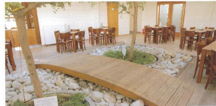
Dieser Raum bietet ein entspanntes Flair, damit die Pause auch genossen werden kann.