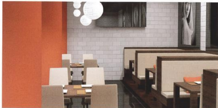
In der Gastronomie sind innovative Ideen besonders gefragt, um den Gästen stets neue Anreize für einen Besuch zu liefern. Ein ideales Betätigungsfeld für Ihren Tischler – lassen Sie Ihrer Kreativität freien Lauf.