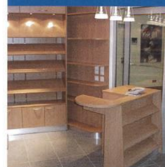
Praktisch und gediegen: Einbau einer Ladeneinrichtung.